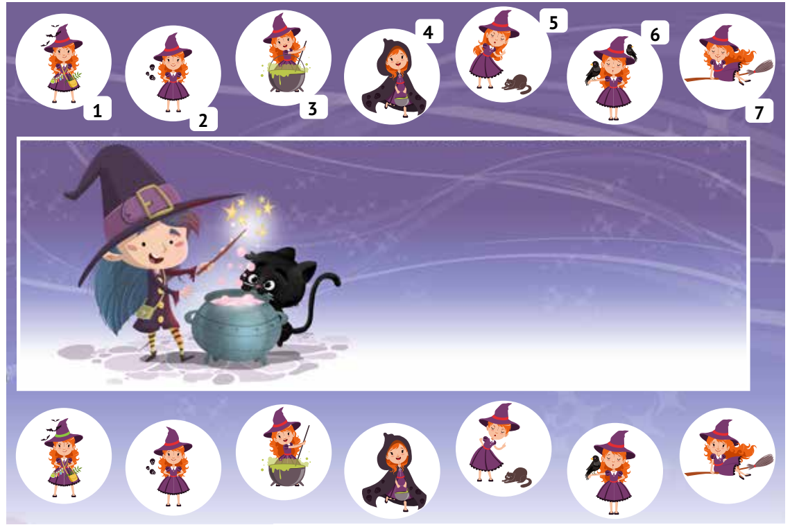
Grafiken: cirodelia, topvectors / Adobe Stock; Montage: SoVD

Auf unserem Bild siehst du sieben Hexen, die sich zum Kräutersammeln im Wald verabredet haben. In der unteren Reihe ist jede Kräuterhexe noch einmal abgebildet. Doch dabei haben sich einige Fehler eingeschlichen: Nur eine Hexe sieht auf beiden Bildern genau gleich aus – kannst du sie finden?