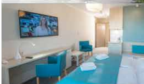
Zimmerbeispiel, 3+ Aparthotel Nad Parseta

Beratung & Buchung: 0800 - 228 42 66 gebührenfrei / Mo.-Fr.: 9-17 Uhr