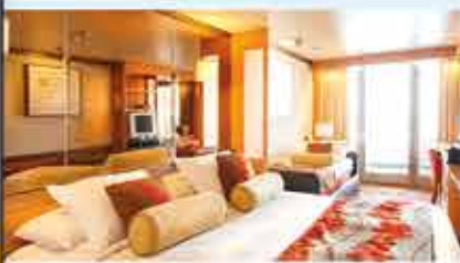
Außenkabine mit Balkon, 4+ VASCO DA GAMA

Bremerhaven – Edingburgh – Belfast – Plymouth – Dover – Bremerhaven 09.08.-23.08.2022 15 Tage ab € 2.837,- p.P.