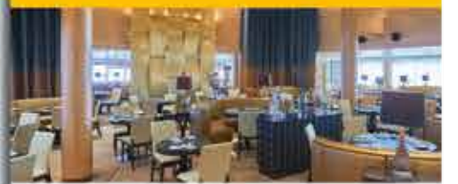
Waterfront Restaurant, 4+ VASCO DA GAMA