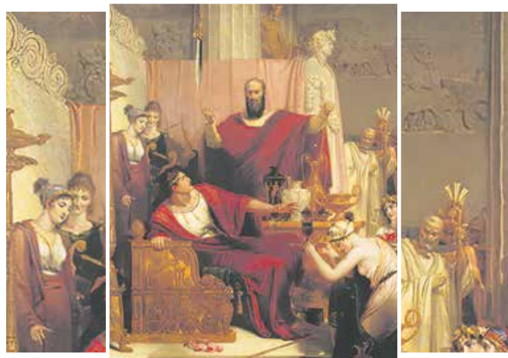
Richard Westalls Gemälde „Das Schwert des Damokles“ (1812).

Dionys von Syrakus gehörte zu den mächtigsten Herrschern der Antike. Viele neideten ihm seine Macht, so auch der Höfling Damokles. Dem Emporkömmling wollte Dionys der Sage nach eine Lehre erteilen und überließ ihm hierfür seinen Platz an der Tafel. Über dem Stuhl aber ließ der Potentat an einem dünnen Faden ein Schwert aufhängen. Auf diese Weise wollte Dionys die Gefahren verdeutlichen, die eine derart mächtige Position mit sich bringt. Bekanntheit erreichte diese Begebenheit auch als „Schwert des Damokles“.