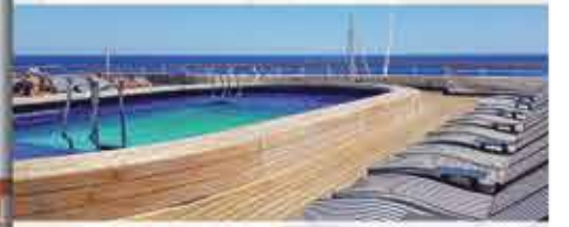
Oasis Pool, 4+ VASCO DA GAMA

Weitere Informationen im neuen Katalog 2022 - Jetzt anfordern!