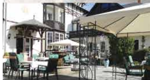
Terrasse, 3+ Schlosshotel Marienbad