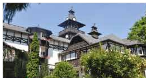
3+ Schlosshotel Marienbad

Freizeit/Kur/Unterhaltung: Wohltuende Kur-Anwendungen, wie bspw. Massagen, Moorpackungen, Elektro- und Magnettherapie, werden Ihnen in der hauseigenen Kur-Abteilung angeboten.