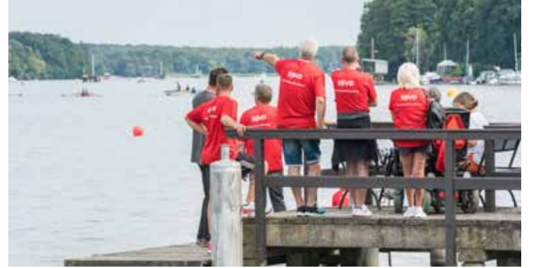
Beim „tag des wir“ steht gemeinsames Erleben im Vordergrund.

gemeinsamer Stammtisch oder Hindernisparcours – Fantasie ist gefragt, wenn es um das Miteinander in Aktion geht. Für Ideen kann außerdem die vom SoVD herausgegebene Ideenbroschüre „Hand in Hand“ dienen, die wir Ihnen gerne auf Anfrage zusenden und die Sie sich unter www.sovd.de/broschueren bei „Ehrenamt“ herunterladen können.