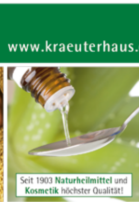
Entwicklung und Herstellung im eigenen Haus