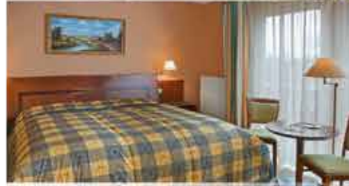
Zimmerbeispiel, 3+ Schlosshotel Marienbad