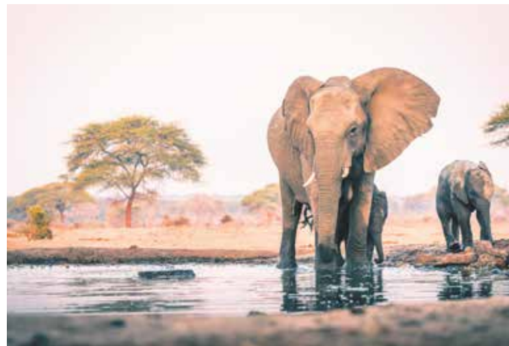
Elefanten vergessen nie: Sie finden nicht nur Wasserstellen wieder, sondern merken sich auch, wer sie einmal schlecht behandelt hat.

Noch nach mehreren Jahrzehnten erinnern sich Elefanten an Wege zu Futterplätzen oder Wasserstellen. Das macht gerade ältere Leittiere für eine Gruppe unendlich wertvoll. Denn sie sichern zum Beispiel in einer Dürreperiode das Überleben der Herde und geben ihr Wissen an die Jungtiere weiter.