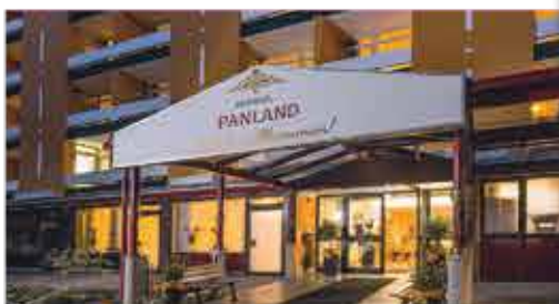
3+ Kurhotel Panland

Freizeit/Kur/Unterhaltung: Entspannte Stunden verbringen Sie in der hauseigenen Sauna oder Infrarotkabine des Hotels oder lassen Sie sich bei wohltuenden Wellnessbehandlungen (gg. Aufpreis) verwöhnen. Für den sportlichen Ausgleich bietet Ihnen das Hotel einen Fitness- und Gymnastikraum.