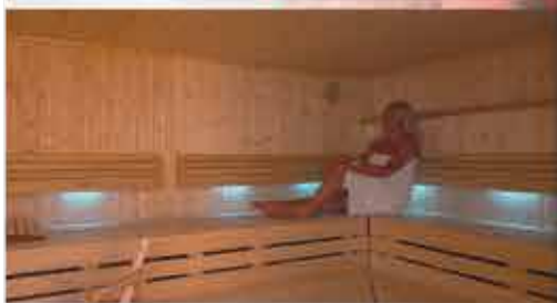
Sauna, 3+ Kurhotel Panland