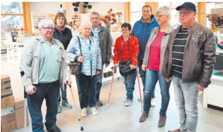
Die SoVD-Gruppe erhielt Einblick in die Produktion der Halberstädter Glashütte „Harzkristall“.

ginalbelege einzuscannen, dann zu vernichten und den Mietenden Ausdrucke zur Verfügung zu stellen. Etwas anderes gelte aber, wenn die Unterlagen woanders noch bereitgehalten werden. In diesem Fall müsse die*der Vermietende entweder die Unterlagen beschaffen oder den Mietenden die Einsicht ermöglichen (AmG Ludwigslust, 44 C 504/20). wb