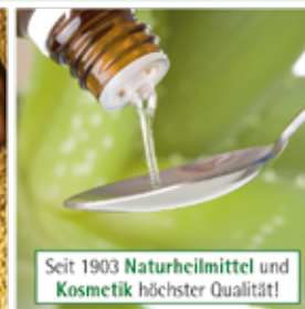
Entwicklung und Herstellung im eigenen Haus