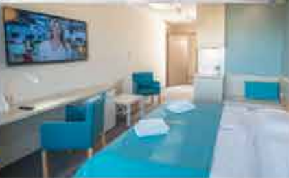
Zimmerbeispiel, 3+ Aparthotel Nad Parseta