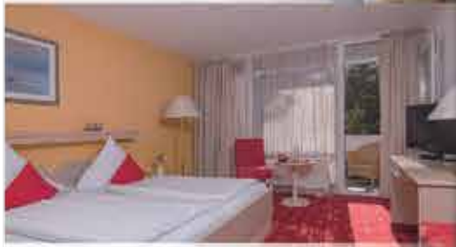
Zimmerbeispiel, 3+ Kurhotel Panland