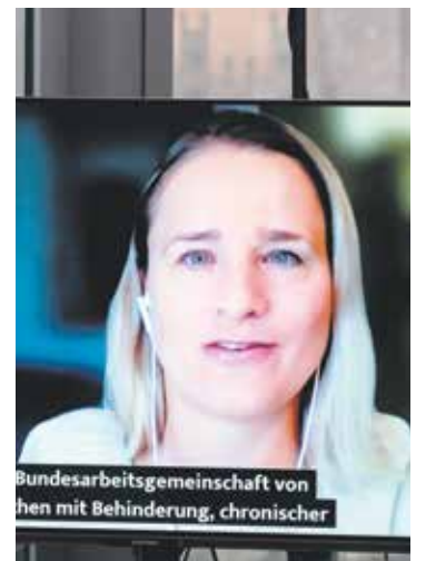
VdK-Präsidentin Verena Bentele war aus München zugeschaltet.