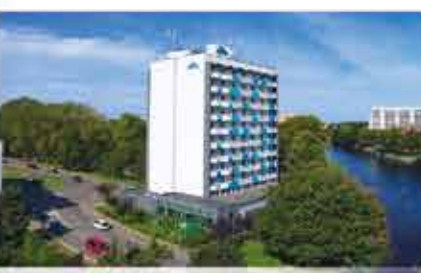
3+ Aparthotel Nad Parseta

Freizeit/Kur/Unterhaltung: Die Kur-Anwendungen erfolgen in den hauseigenen Behandlungsräumen. Es werden bspw. Moorpackungen, Bäder, Massagen und Inhalationen angeboten. Im Hotel befinden sich darüber hinaus ein kleines Schwimmbad (2 x 5 m, ca. 27°C), Whirlpool, Fitnessraum (kostenlose Nutzung) sowie eine Salzgrotte und eine finnische Sauna (jeweils gg. Gebühr).