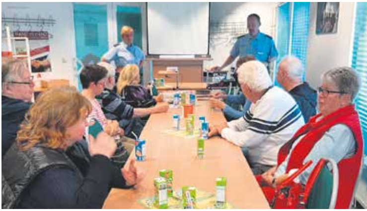
Die Polizei hielt einen Vortrag im Kreisverband Halberstadt.